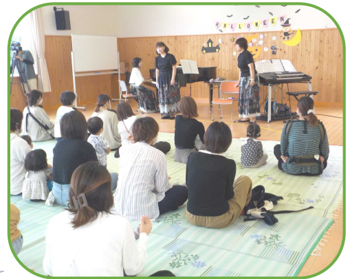
みんなの知っている曲が たくさん聞けたね