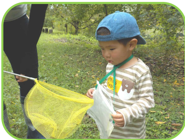
これ なんの 虫かなあ...