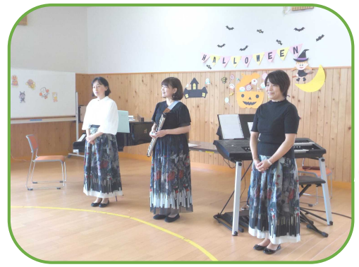
ミュージックボックス フィガロのみなさん

10月5日(木) 企画事業 「ドレミファコンサート」 ミュージックボックス フィガロ さんによるコンサートが行われました。 素晴らしい楽器の音色や歌声に、 会場は盛り上がりました。 子どもたちも、体を揺らして リズムにのっていました。