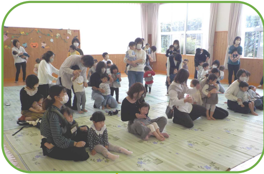
ジャンボリーミッキー みんなで踊ったよ!