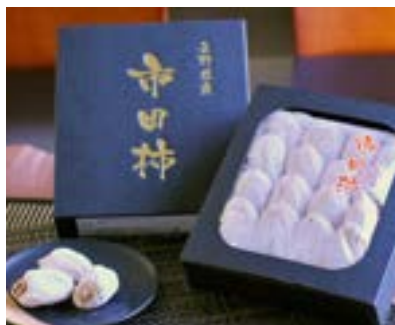
MS21-24A 収穫時期 2025年1月上旬頃～