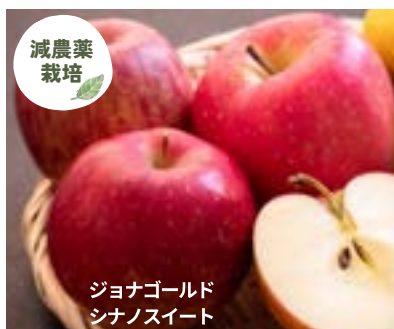
YN17-24A 発送時期 10月上旬頃～