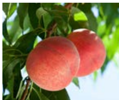
KM01-24A 発送時期 7月下旬頃～