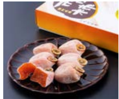
AS11-24A 発送時期 12月下旬～2025年1月上旬頃