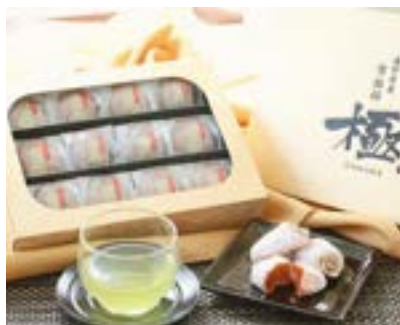
MS20-24A 収穫時期 2025年1月上旬頃～