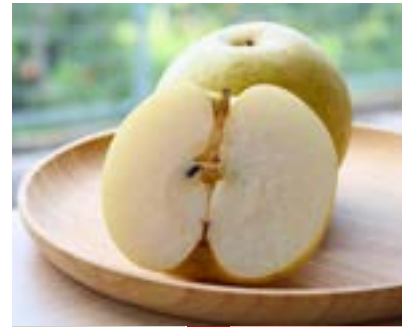
KW02-24A 発送時期 9月中旬頃～