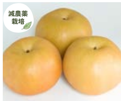
YN09-24A 発送時期 9月中旬頃～