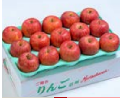
AS09-24A 発送時期 11月下旬頃～