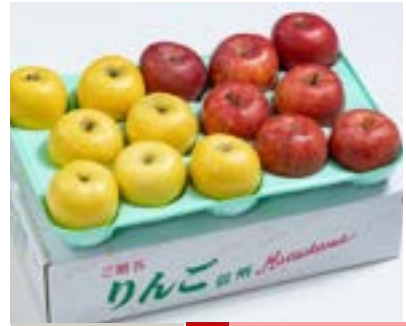
AS10-24A 発送時期 11月中旬頃～