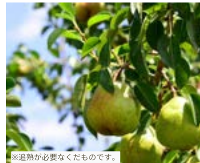
KL01-24A 発送時期 10月中旬頃～