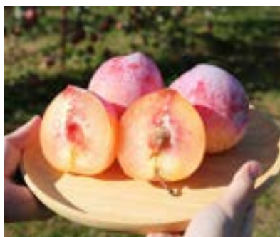
KP03-24A 発送時期 9月中旬頃～