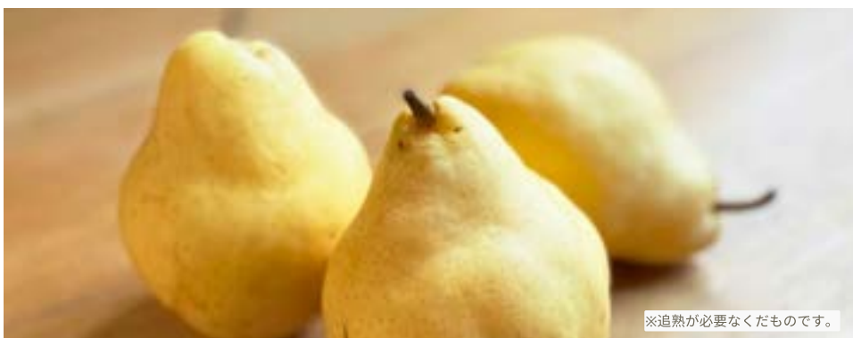
※追熟が必要なくだものです。