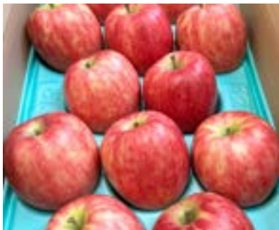
KR23-24A 発送時期 9月中旬頃～