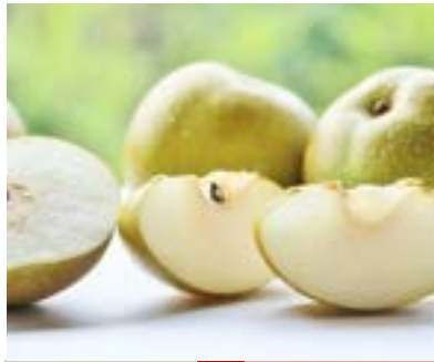
KW08-24A 発送時期 9月上旬頃～