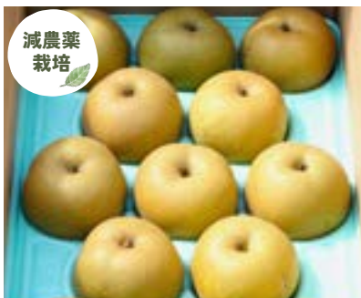
YN07-24A 発送時期 8月中旬頃～