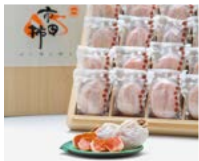
JA20-24A 収穫時期 2025年1月中旬頃～