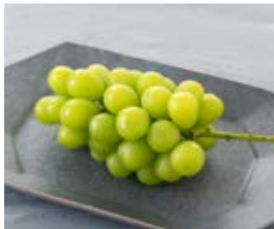
KG01-24A 発送時期 9月下旬頃～