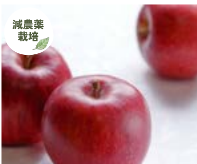
YN12-24A 発送時期 10月上旬頃～