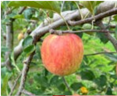
KR22-24A 発送時期 8月下旬頃～