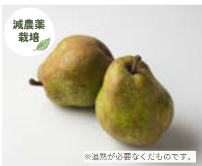
YN10-24A 発送時期 10月中旬頃～