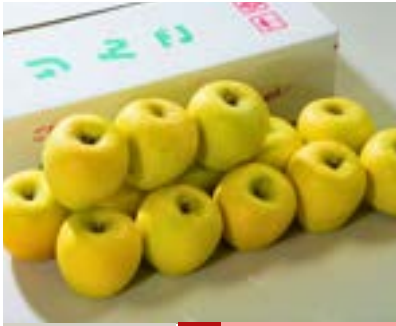
AS08-24A 発送時期 10月下旬頃～