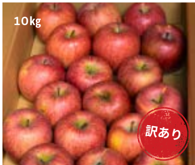
AS13-24A 発送時期 2025年1月中旬頃～