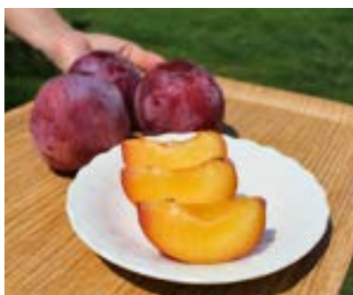
KP01-24A 発送時期 8月中旬頃～