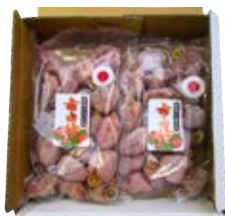
TK12-24A 発送時期 12月頃～