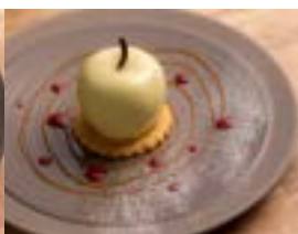
お食事は松川町と伊那谷の果物、野菜、肉や川魚を使った季節のフレンチ料理。

ご入金期限：10月末 開催：土日（ランチ/ディナー） ご入金後チケットと資料をお送りします。ご覧の上、ご予約をお願いいたします。 有効期限：発行日より1年