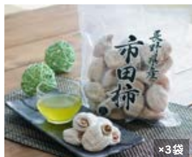
MS25-24A 発送時期 2025年1月上旬頃～