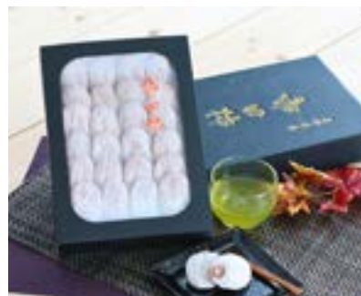
MS22-24A 収穫時期 2025年1月上旬頃～