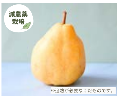
YN11-24A 発送時期 11月下旬頃～