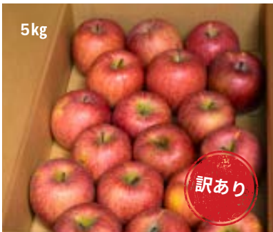
AS12-24A 発送時期 2025年1月中旬頃～