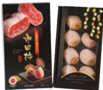
JA40-24A 収穫時期 2025年1月中旬頃～