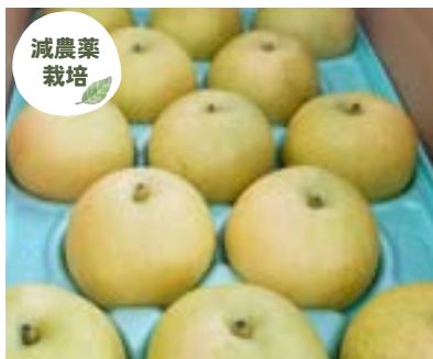
YN08-24A 発送時期 9月上旬頃～