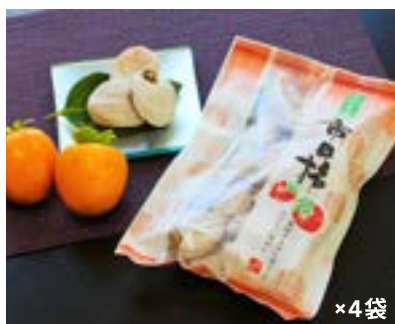
MS24-24A 発送時期 2025年1月上旬頃～