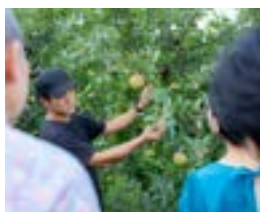
園主によるツアーガイド