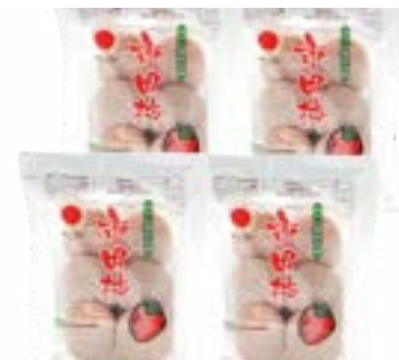
JA38-24A 収穫時期 2025年1月中旬頃～