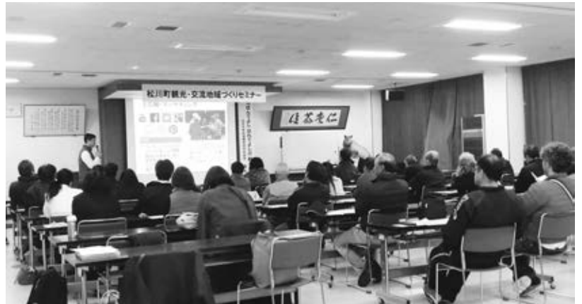
セミナー風景写真