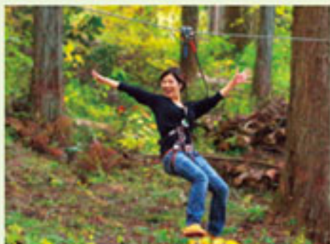
フォレストアドベンチャー