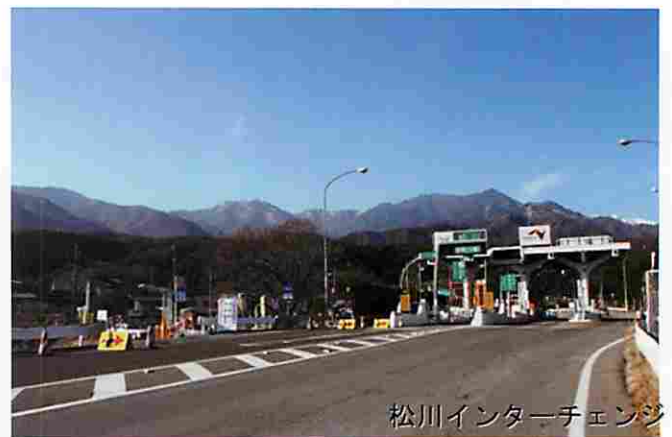
松川インターチェンジ