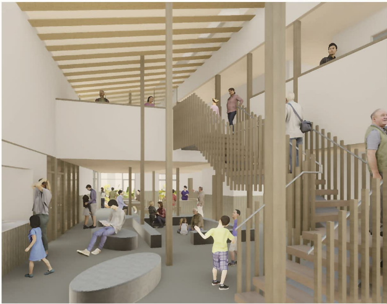
みんなのリビング