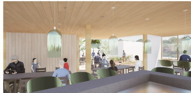
みんなのダイニング