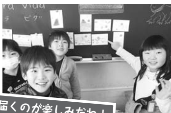
選手に届くのが楽しみだね！