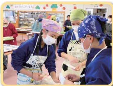
中学生のボランティアも大活躍!