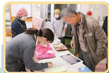
民生委員の方が、ご自宅まで届けてくれます。