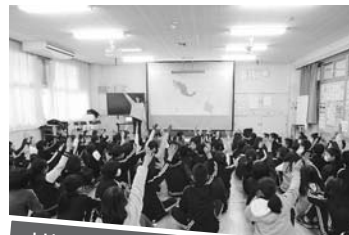
オリ・パラやコスタリカについて学んだよ

この手紙は、3月開催のコスタリカ・スタディツアーに参加する高校生が、現地で選手・オリンピック委員会に手渡します。