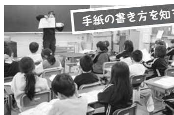
手紙の書き方を知ろう

中央小、北小、中学校の児童・生徒が、コスタリカへエールを送るため、絵はがきを書きました！オリンピックやパラリンピック、コスタリカについて学習したあと、「がんばれ」「松川で待っています」など心を込めてメッセージを考えました。競技やメダルの絵を描いたり、カラフルにしたり、一人一人素敵な手紙ができました。