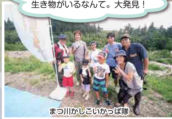
まつ川かしこいっば隊