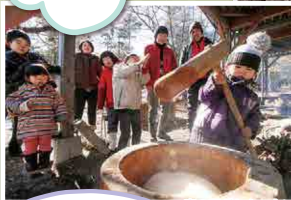
森の子どもクッキング（冬）

自然からもらった色で 染物をしたよ。植物によっ もらえる色も違う。 色もいろいろ。