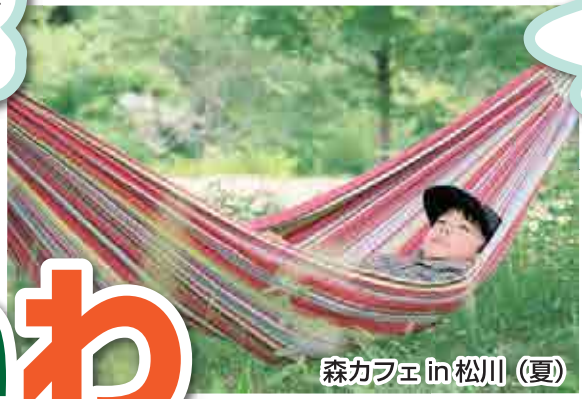
森カフェ in 松川（夏）