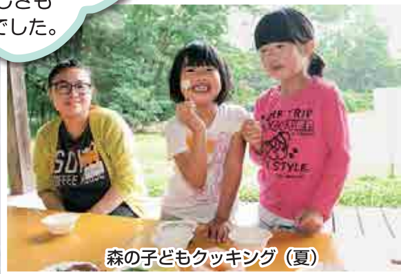
森の子どもクッキング（夏）

手づくりの ポテトチップス最高！ なにせ自分で つくったからね。 おいしさも 格段でした。