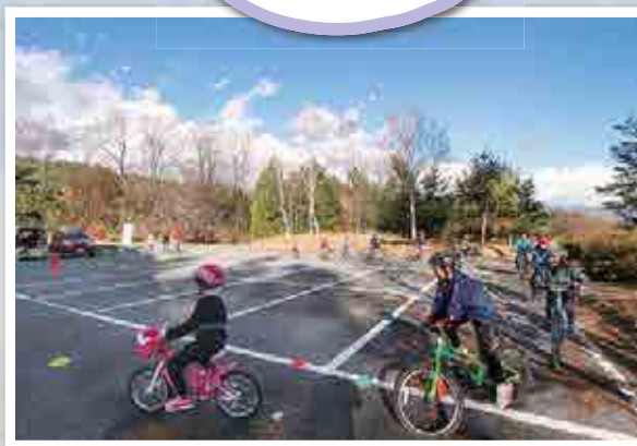
ウィラースクールin松川