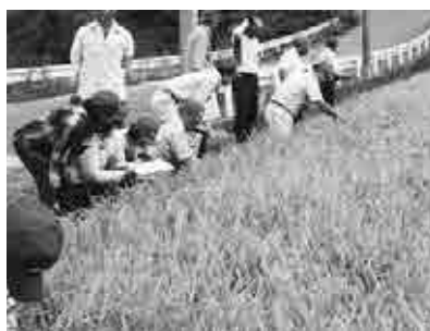
水稻作況調査の様子

今年度は、多くの団体と意見交換会を行い、今現在の農業の状況から今後どのようなことが必要になるのか、どのような活動をすれば改善されるのかなど、主に町の農業の未来について話し合いました。