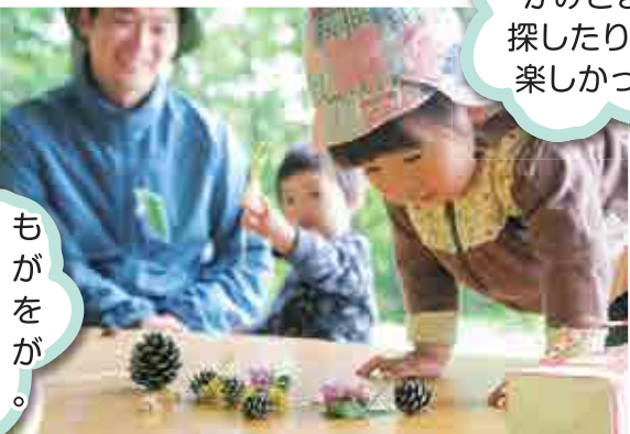
おやこでおさんぽ会（夏）