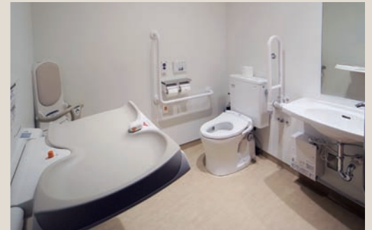
各階にある多目的トイレ