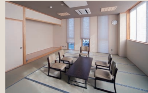
茶道・華道など日本文化にふれる和室