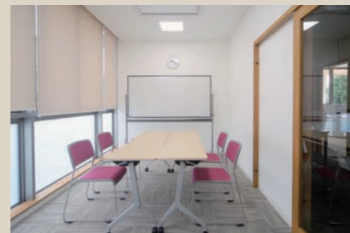
印刷しながら使える談話室