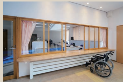
親しみやすく利用しやすい窓口