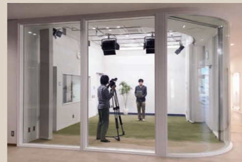
番組の収録や制作の様子を見学できます