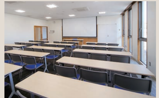
約50人の会議に対応できる学習室1