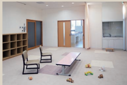
カーペット敷きの交流室(授乳室付)