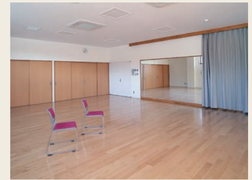
防音設備と鏡のある学習室3