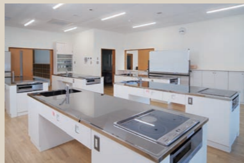
設備の整った調理室