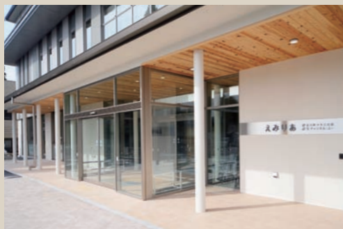
広いひさしのある玄関前の軒下 光が感じられる、明るく開放的な玄関ロビー