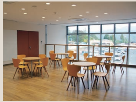
ゆったりとした2階ラウンジ