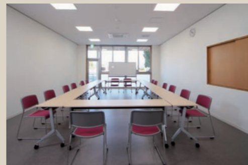
調理室ともつながる会議室