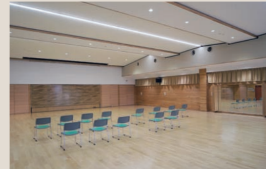
収納式舞台のえみりあホール