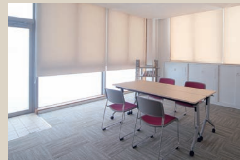
明るい教育相談室