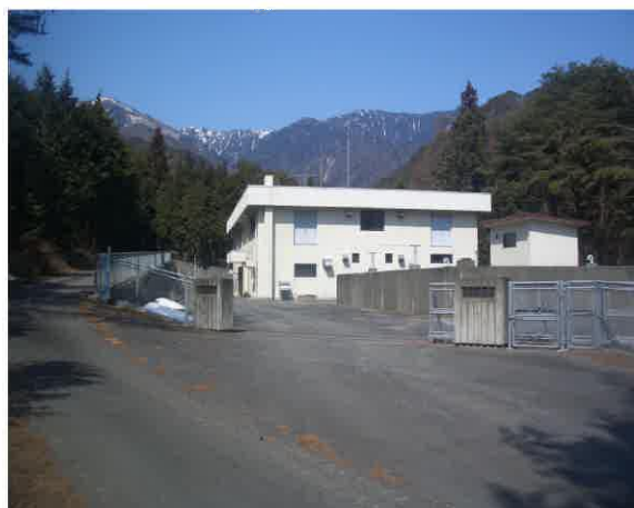
松川町 中桐浄水場

松川町水道事業では、水道水の安全性など水道に対するお客様の信頼を得るため、水質検査計画を作成し、検査計画及び検査結果を公表します。