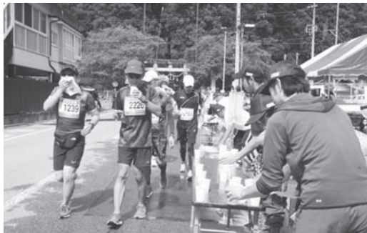
スタッフ、ボランティアの皆様、本当にありがとうございました！