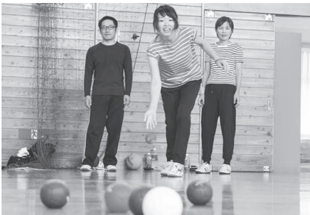
ジャックボールの近くをねらって投げる