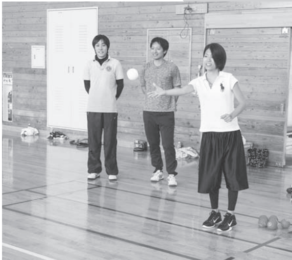
ジャックボールを投げる