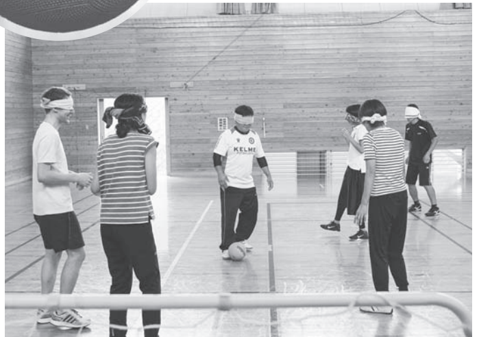
ゴールは正面。うまく入るかな。