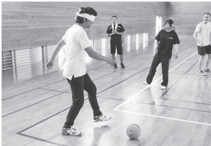
ボールに入った鈴の音でボールを探す。

うに静かな環境でプレーする。「音」と「声」のコミュニケーションが重要なスポーツ。