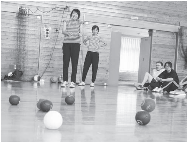
ジャックボールを基準に得点を数える

ジャックボールと呼ばれる白いボール（目標球）を投げた後、対戦する両者がそれぞれ赤と青の6球を投げ合い、自球をよりジャックに近づけたチームまたは個人が勝者となる。（ペタンクを経験したことのある人は、ルールが似ているのでわかりやすいと思う。）