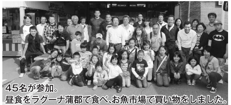
45名が参加。 昼食をラグーナ蒲郡で食べ、お魚市場で買い物をしました。

愛知県蒲郡の竹島遊園に潮干狩りへ。 天候にも恵まれてたくさんの貝を拾うことが できました。