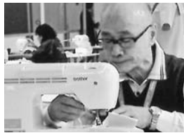
フランス・ポルドーでの大会の様子。制限時間6時間で型紙取り、生地を裁断、縫製、仕上げのアイロンがけまでを行います。会場へ持ち込める道具はハサミ、針など決められたもののみ。主催者が用意したミシンは家庭用だったため、日ごろ使用している工業用、職業用とは勝手が違ったそう

大会では制限時間内に課題のブラウスを仕上げため、いくつものデザインを想定し、一年前から特訓を開始。苦手を克服しようと「ボタンホールの手縫い」には特に時間をかけ、一つを15分で仕上げられるまでに技を磨きました。