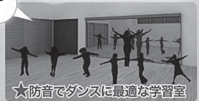
★防音でダンスに最適な学習室