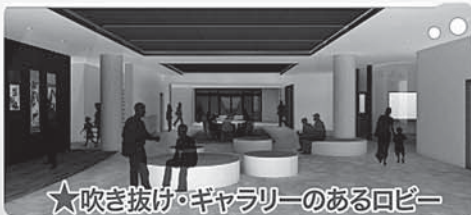
★吹き抜け・ギャラリーのあるロビー