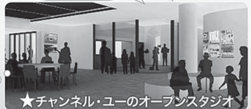
★チャンネル・ユーのオープンスタジオ