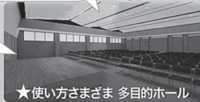
★使い方もさまざま 多目的ホール