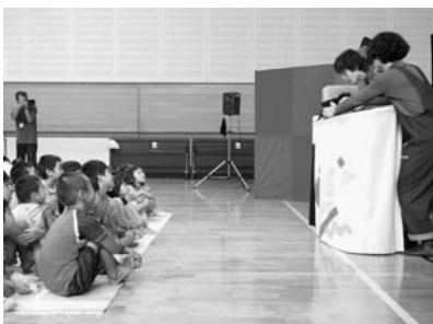
たくさんの子どもが集まる人形劇場

社会部一同、これまで以上に関係団体の皆様と共につながり、活動していきたいと思っておりますので、ご協力をお願いいたします。