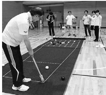
町に広まりつつある囲碁ボール

ティー発展を促すこと」を目標に皆様との絆がより一層深まればと思っております。本年度も体育部一同、皆様に喜んでいただけるよう、精一杯活動してまいりますので、町民の皆様のご理解と関係される皆様のご協力を宜しく願います。