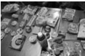
竹下先生持参の非常食の数々