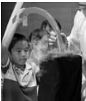
液体チッ素でドキドキ実験

町体のトレーニングルームに集まった子ども達とつきそいの大人達。「おもしろ科学工房」の皆さんが準備されるようすを興味津々で見つめています。これから「おもしろサイエンスショー」として数々の化学実験が行われます。始めにテーブルの上に黒い布におおわれた入れ物が用意されました。この日は、職場体験の松川中学校の生徒さんもジャージ姿でお手伝いです。そこで登場するのが長風船。いっぱい空気の入った風船を子ども達が次々と黒い容器に入れると……長い風船が全部、小さな容器に入ってしまった。子ども達はもちろん、大人(特にお父さん)も体験し大人気です。さて容器の中は？