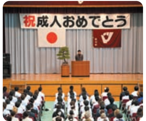
仲間の主張を真剣に聞く