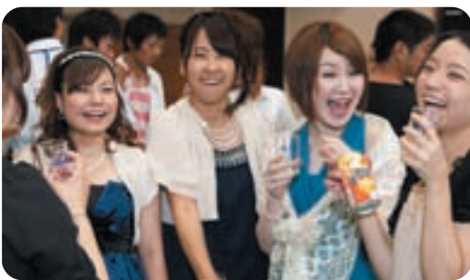
昔話で話もはずむ

長いようで短かったこの20年という月日の間に、私たちはどれだけでも多くの人に出逢い、支えられて生きてきたことでしょうか。自分を最後まで信じてくれた父・母そして家族。時に厳しく、時に優しく背中を押してくれた恩師の方々。喜怒哀楽を共有し、共に笑いあえた友人たち。今まで数えきれない人との出逢いに支えられて生きてくることができ、今年で東日本大震災が起き