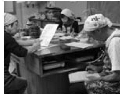
熱心にメモをとる参加者