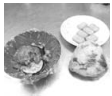
出来上がった防災食。ラップを敷くと汚れません。