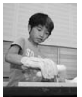
バナナでクギが打てました

絶対零度の液体窒素が入っているため風船の空気は液体になり、体積が小さくなってしぼみませんが、外に出せば元通りに。 テレビでよく見るバナナでの釘打ち、花が手でパリパリに砕ける、ゴムボールが硬くなって割れるなど次々と液体窒素を使った楽しい実験が体験できました。 その後は、リニア中央新幹線に応用されている超電導磁石の実験。リニア新幹線は、磁石のN極とS極が反発し合って浮く力を利用して……という程度の知識しかないのですが、資料を見ながら模型を動かしてみました。実際のリニア新幹線が早く見たい、と感じました。