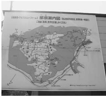
わかりやすい案内看板が立てられています

「部奈にシジミがいる」という噂をきき、その真偽を確かめるために公民館編集部では部奈地区の探検を始めました。そんなことがきっかけではじまった今回の取材で学んだのは、部奈地区の人たちと自然との関わり方でした。 一昨年の公民館研究集会では、「自然が荒れてきた」「自然のものを活かした生活が少なくなってきた」などの意見が多くだされ、自然環境の維持は松川町にとっても重要な課題の一つです。この号では、シジミの棲息地やさとやま自然園での取り組みから人と自然との関わり方について考えてみたいと思います。