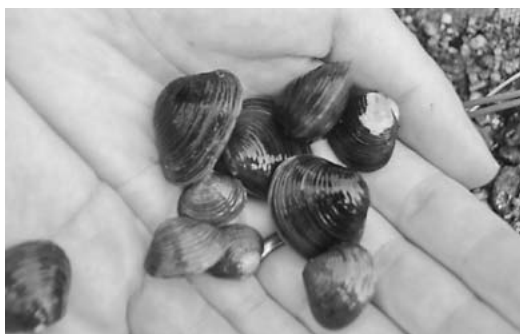
たくさんシジミを発見 大きいものは最大で3cmくらいまで成長する