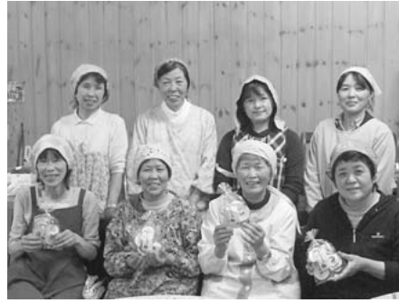
『新星ましの』のみなさん

農村女性ネットワーク『新星ましの』の皆さんは、そば打ちや豆腐づくりなどの活動を行ってきましたが、規格外