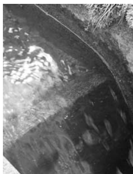
砂がたまるように工夫している