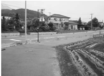
新しくできた花壇 (中荒町)