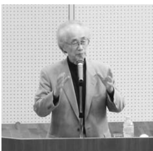
5/26に開催された第1回目の講師 経済評論家の内橋克人さん

受講者募集案内の冒頭にある、「多彩な講師を招き、楽しみながら一緒に学んでみませんか」とのスローガンのもとにまっかわ大学も今年で第7期を迎えました。毎年度4回開講されるに当りいかなる講師が招かれるか楽しみます。政治、経済、社会、スポーツ、芸能等における著名人であればその関心度も増します。 いわばその道のプロ、自らの体験から得られた自信からこそ、話題性があり、また説得力があります。時として、普段私達には到底分らない分野、いわばその裏側に秘められたエピソードも聴くことができるのも魅力であります。またどこまで踏み込んで本音が語られるか、え！本当？そなの？思わずこんな言葉も。一語一句感