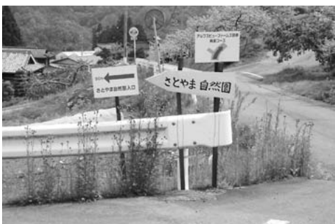
部奈には案内板があちこちに…

の中で、少しでも条件が違ってしまえば生息できなくなり、人が関わりすぎても、逆に関わらなくても、生息できないことに気づき、自然の奥深さを感じました。 部奈地区では、部奈全体を一つの自然公園として位置づけています。部奈に一歩足を踏み入れると観光スポットを案内する看板の多さに気付きます。看板は部奈の長所である、眺望、自然、史跡、石仏等を細かく案内してくれ、初めて訪れた人でも、部奈全体を楽しむことができます。新緑のまぶしい季節になります。松川が誇る壮大な部奈の自然を皆さんも是非一度肌で感じてみてはいかがでしょうか。