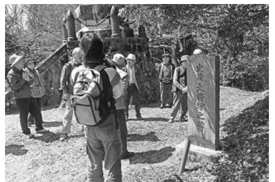
大将陣 秋山信友や大島氏らが処刑されたと伝えられる