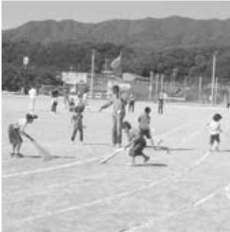
ホウキ、デッキブラシ…どれが当たるか運ませ (ボールたたき)