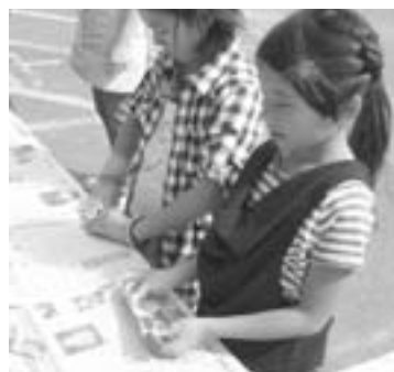
完成後の点火は大人と一緒にね!

使う燃料は台所にある食用油です。お湯も沸かせるコンロが、ごく身近な材料で作れるのは驚きです。災害等もしもの時に役に立つ知識と経験。大人も子どもも今から備えておきたいものです。