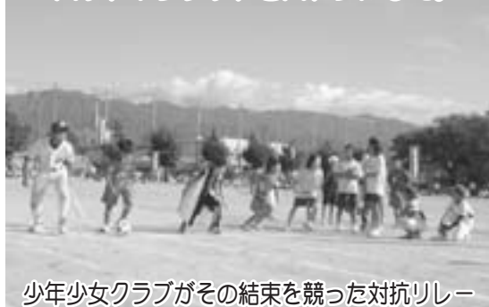
少年少女クラブがその結束を競った対抗リレー