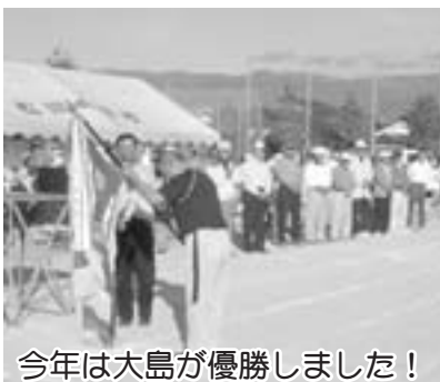
今年は大島が優勝しました！