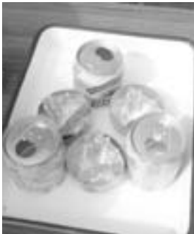
3つの缶・ティッシュ・アルミホイルがあれば作れます