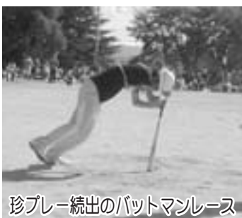
珍プレー続出のバットマンレース