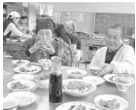
みんなで食べると いちだんとおいしいなん

参加された方からは「塩分が少ない料理なのにおいしく感じた」「野菜を色々入れて味つけもさっぱりして美味しかった」「大変ヘルシーでわが家では味がちよつと濃すぎないのでないかなと思つた」などの感想が聞かれました。