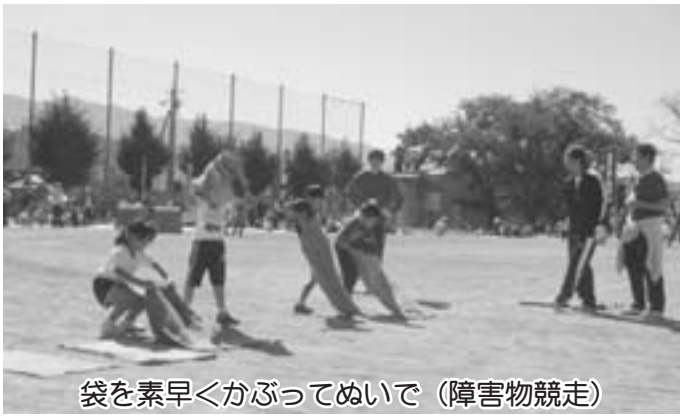
袋を素早くかぶってぬいで (障害物競走)

今年も、町内3会場で開催にむけて準備が進められてきた町民運動会。上片桐・生田会場は前日の大雨によりグラウンドコンディションが悪く残念ながら中止となってしまうましたが、大島会場は強烈な日差しの下、開催されました。参加各地区の熱戦の様子をお伝えします。