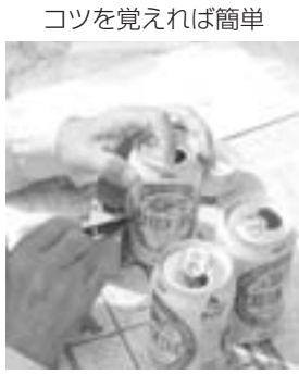
アルミ缶をハサミで切る。