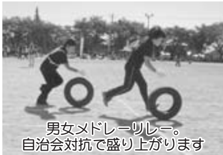
男女メドレーリレー。自治会対抗で盛り上がります