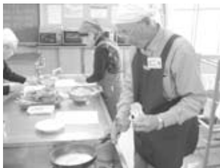
水かげんがかんじんです

簡単な手順と解説を聞いたら3つの班に分かれて調理開始。みなさん現役で調理をされている方ばかりなので手早く調理していきます。おかげで予定よりも30分近く早く料理が出来上がりました。