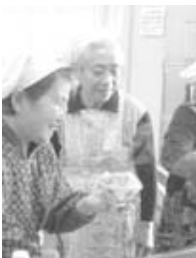
分量どおりだと山盛りだに