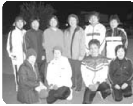
料理教室などもしています

町で行っていたリフレッシュウォーキングが終了し、その後どうするかということになり、