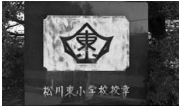
松川東小学校校章

生田村と松川町の合併にともない生田東小学校から松川東小学校となつて今年が50年の節目。 それを記念する式典が松川東小学校の体育館を会場に、学校関係者、地域の皆さんなど多くの参列者を迎えて開催されました。