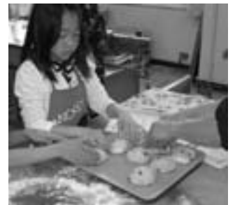
クッキー生地をのせたら発酵させてからオープンへ

この二日後、信長は再度書状を発し、 「飯田・大島落去に付きて、高遠一城を相抱うるの由、聞き届け候」とし、有力な城では高遠だけが敵方に確保されていることを了承し、油断してはならないことを伝えていきます。そして前回にも伝えた通り、占領地に城(陣地)を築き、後方