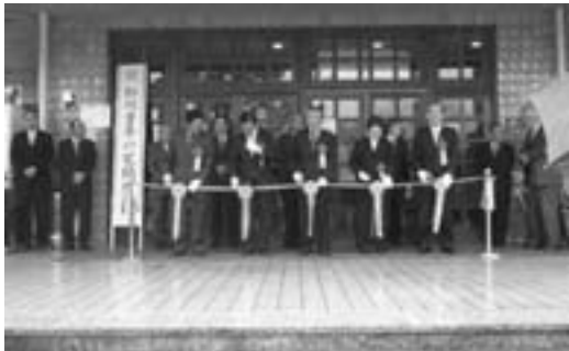
開所式テープカット