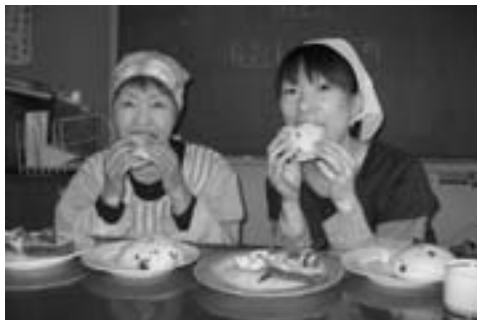
笑顔でいただきます