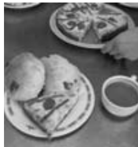
きれいに盛り付けたら出来上がり