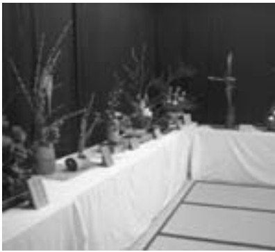
1つ1つの作品のこだわりが光る