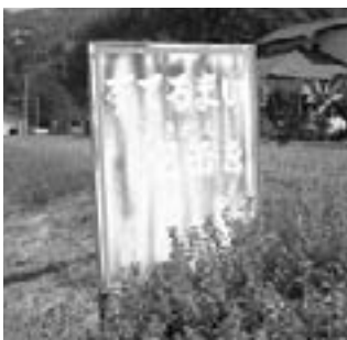
“すてるまい空缶”と書かれています