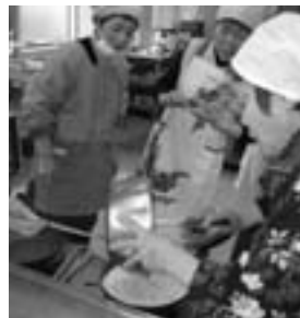
副菜のオープンオムレットを焼きます