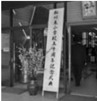
桜が皆さんを迎えます

生田村と松川町の合併にともない生田東小学校から松川東小学校となつて今年が50年の節目。 それを記念する式典が松川東小学校の体育館を会場に、学校関係者、地域の皆さんなど多くの参列者を迎えて開催されました。