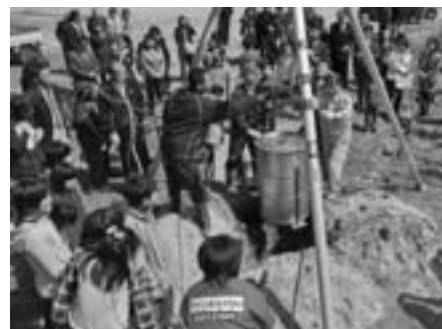
さあ、タイムカプセルが埋められます