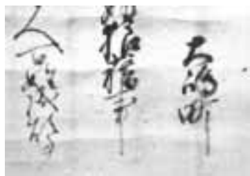
織田信長禁制に記された「大島町」の文字

天正10年に大島城が落城し た時、織田信長が出した「禁 制」には、大島城の前面の町 屋は「大島町」と記されてい ます。当時、この一帯におけ る政治・経済の中心地として 古町の大地上に「大島町」が