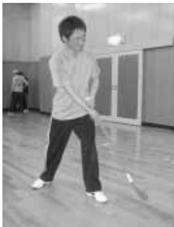
スティックは膝より低く(ルールによっては腰より下)