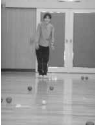
ビュットにねらいを定めて

「狙った所にいかない」最初に投げた感想はこれにつきまず。狙って投げたボールは、コロコロ転がってビュットからはるか遠くまでいってしまいます。転がさないようにするコツは、ひざを使い手の甲を上にして投げ上げて落とす事だと教えてもらい投げてみるとたしかに止まります。それでもなかなか狙った所には