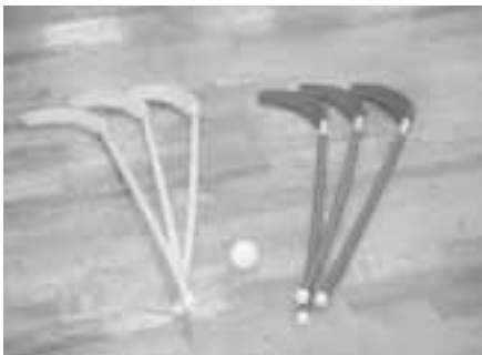
スティックもボールも軽〜い素材

ジがかめるでしょうか。もちろんアイスホッケーよりも手軽なスポーツです。道具はスティックとボールだけ。タックルはナシなので頑丈な防具は必要ありません。