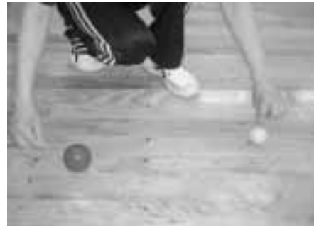
ビュットに近いチームの勝ち

に負けたチームの1番ビュットに近いボールよりも内側にあるボールの数が得点になります。ビュットの前にボールを投げて相手の邪魔をしたり、相手の