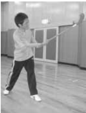
振り上げすぎは反則です。顔に当たらないでネ

1チーム6人ずつで、2チームで対戦。ボールをまわし、相手のゴールにボールを入れれば点が入ります。前後半それぞれ10分ずつプレーし、制限時間までに点が多かったほうが勝ちです。状況によってはプレーするコート