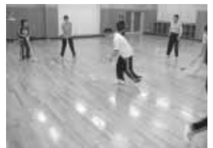
思わず猛ダッシュ！ケガには気をつけて

の広さや人数を変更すれば、参加するプレーヤーに適した試合運びで楽しめるのではないのでしょうか。やり始めると熱くなりますよ！