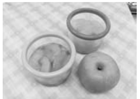
梨（幸水）のコンポート