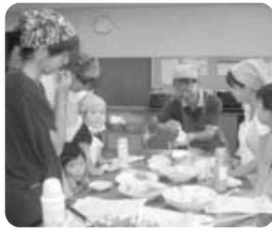
この日は焼きカレーパン 仕上げも丁寧に

翌月の予定や今後の方針もこれから話し合っていて決めていくというところで、手探りで活動しているところも新鮮な教室です。