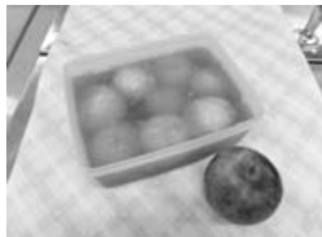
すもも（貴陽）のコンポート