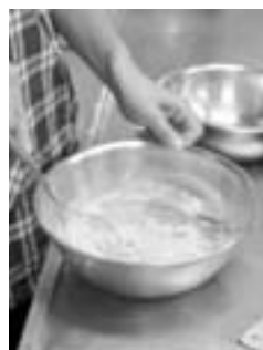
パウンドケーキの下地