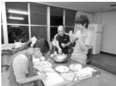
真剣な表情の部員