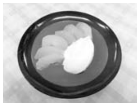
梨のコンポートアイスクリーム添え