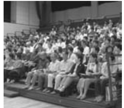
命の大切さを学ぶ受講者