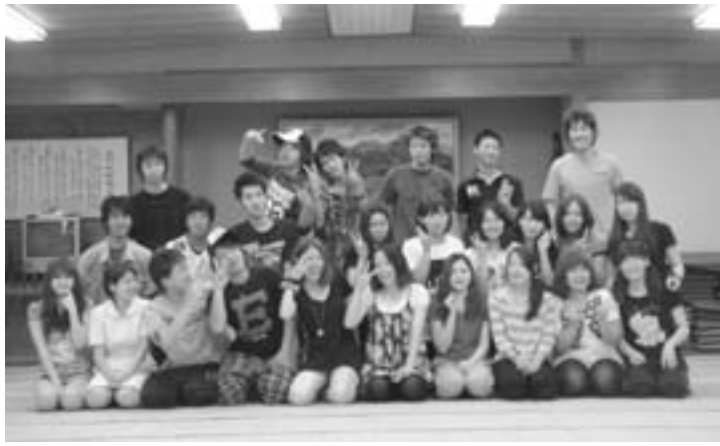
成人式実行委員会のみなさん

どんなに素敵だろうと思えます。私自身、保育士としても社会人としてもまだまだ未熟でありますので、周囲の方々には大変ご迷惑をお掛けする事があるかと思えます。ですが、これからも学んでいく姿勢を忘れず、日々精進していきたいと思っております。 成人式では仲間の意見発表や、町長様をはじめ、来賓の方々の温かい言葉を受けて、身が引きしまる思いと、これからの新たな一歩