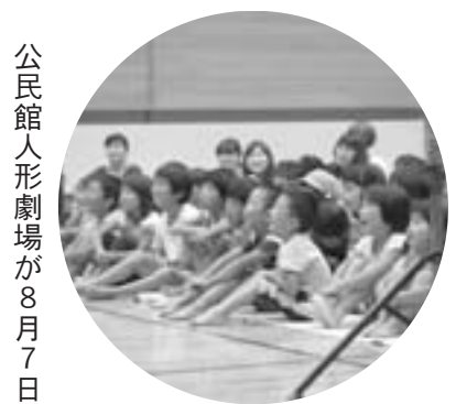
公民館人形劇場が8月7日