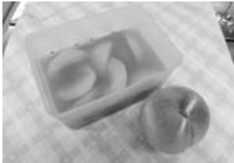
もも（川中島白桃）のコンポート