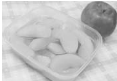
りんご（津軽）のコンポート