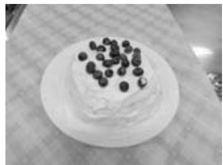
生クリームケーキ

出来上がったケーキなどを きれいに盛り付け、写真を撮つ たあとは楽しみにしていた試 食です。 糖分を控え目にしたことも あり、サッパリした味に仕上 がったそれぞれのスイーツは コンポートがアクセントにな りなかなかの出来映えでした。