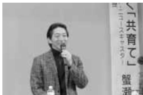
テレビでもお馴染み蟹瀬誠一氏

校内での140名を対象としたアンケート調査の結果からも男女格差のある事がわかった