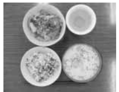
さあ、出来上がりー！