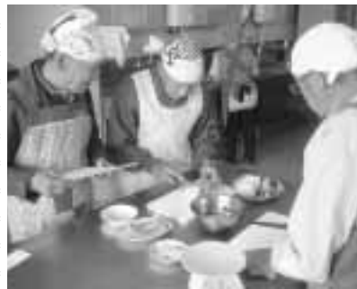
なかなかいい手つき