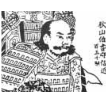
武田二十四将の一人、秋山信友

信玄から大島城の普請を命じられたのは、当時伊那郡代として飯田に在城していた秋山信友です。信友は父の代から武田氏に従つた甲斐の武将で、諏訪占領戦で才能を発揮し、上伊那占領後、若くして伊那郡代に抜擢され、占領後の不安定な上伊那を統治し、府中(松本)や下伊那攻略戦の最前線に立ち、下伊那占領後は高遠・飯田に在城して伊那全郡を預かつていた、信玄の信頼厚い武将でした。当時、片切・大島・飯島・上穂・赤須氏ら中伊那の武士は寄騎として信友に従っていました。