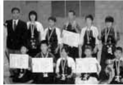
強いぞ！剣道まつかわ

第36回南信少年柔剣道大会が、10月7日(日)に岡谷市総合体育館で開かれました。「剣道の部」の松川町の結果は次の通りです。