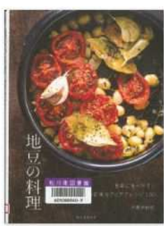
『地豆の料理』 伊藤 美由紀 著 誠文堂新光社