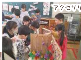
アクセサリー屋さん