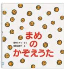
『まめのかぞえうた』 西内 ミナミ 作 和歌山 静子 絵 すずき出版