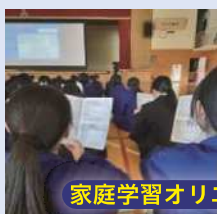
家庭学習オリエンテーション