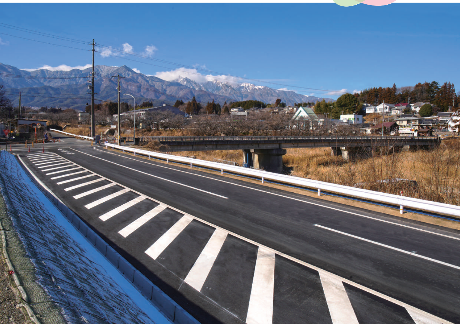
両アルプスを従えて町道洞新線は、片桐松川沿いを緩やかに伸びる