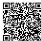
新型コロナワクチン接種 予約サイト