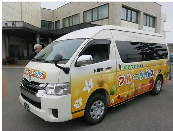
図表 2 デマンドバス運行車両（ハイエース）

予想される移動量から最適と思われる車両（ハイエース 9人乗り）1台にて運行する。利用者が超過する場合は応援車両（セダン型 4人乗り）を1台増車して対応する。